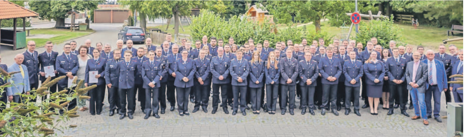
Circa 80 Feuerwehrkameradinnen und -kameraden wurden für ihren Einsatz beim Hochwasser Weihnachten 2023 geehrt.