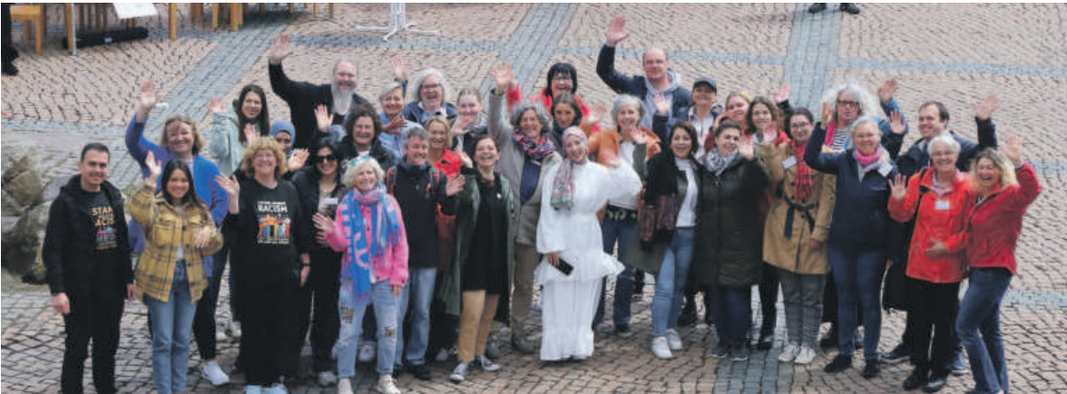
Ein breites Netzwerk von Einrichtungen und Vereinen unter der Koordination der Stabsstelle Integration und Gesellschaft des Landkreises und der Abteilung Integration der Stadt Wolfenbüttel lädt zur Interkulturellen Woche 2025 ein.