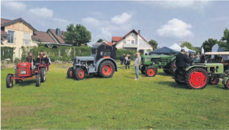
Trecker, die auch beim letzten Mühlenfest dabei waren.