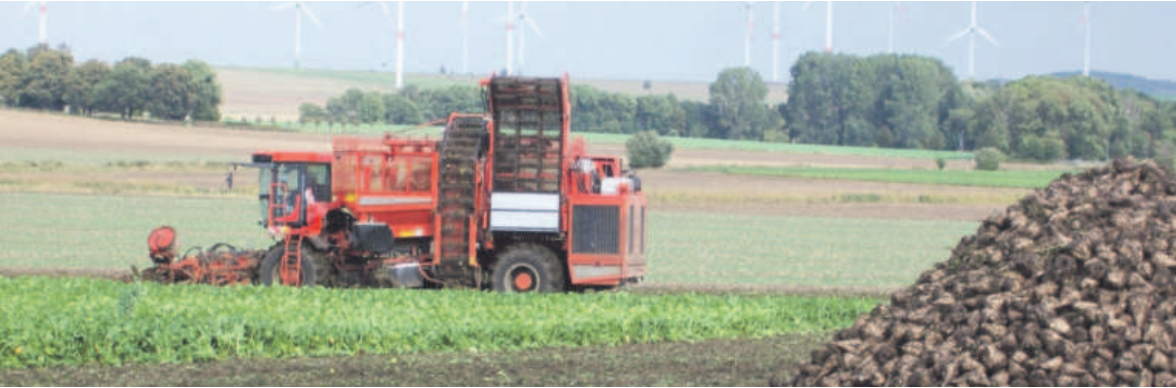
Während der Herbsternte sind viele Erntefahrzeuge unterwegs.

LANDKREIS Hinweise für Autofahrer und Landwirte