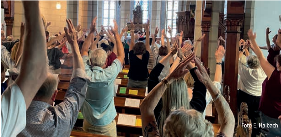
ger danach stand noch selbst gebackener Kuchen bereit. In geselliger Runde und bei kühlen Getränken saß man noch recht lange beisammen und führte so manches Pläuschchen. Lieben Dank an alle fleißigen Hände, es war wirklich ein wunderschöner Abend! E. Halbach

„Erde und Sonne – in Bewegung / Gemeinde – in Bewegung“ das war das Motto des diesjährigen Johannisdienstes gestaltet von der Jungen Gemeinde. Und tatsächlich war der Gottesdienst jung und frisch mit viel Bewegung und Interaktion während des Gottesdienstes. Offensichtlich hatten alle recht viel Spaß dabei. Statt der üblichen Predigt gab Jonas ein recht witziges amerikanisches Quiz zum Besten. Darin eingebettet war auch ein großes Dankeschön an alle Gottesdienstbesucher und Mitarbeitenden der Johannisdienstgemeinde. Im Anschluss an den wirklich erfrischenden Gottesdienst gab's leckere Bratwurst und deftiges Fleisch vom Grill sowie ein schmackhaftes Salatbuffet. Für den kleinen Hun-