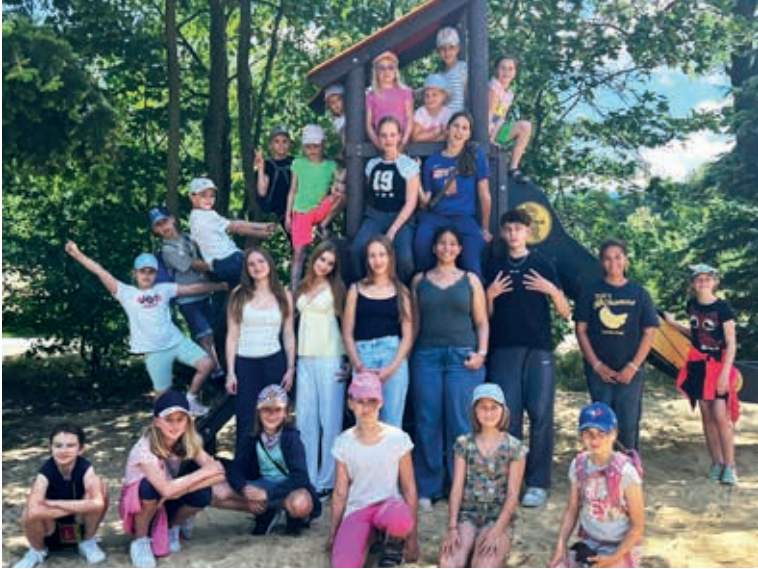
Der Chor beim Probenwochenende Sonntag, 31. August und Montag, 1. September jeweils um 16.30 Uhr in der Christuskirche Weddel statt. Der Eintritt ist wie immer frei. Petra Diepenthalfuder

perlichen Kräfte einsetzen, um an den letzten Tropfen Wasser heranzukommen. Damit nicht genug, sie müssen sich auch noch gegen besonders freche Wasserdiebe wehren. Dies gelingt mit einem überraschenden Kunstgriff nur jemandem, der besonders unerschrocken ist und von dem man es so gar nicht erwartet hätte. Bei aller Ernsthaftigkeit der Thematik kommt der Unterhaltungsfaktor – auch musikalisch – nicht zu kurz; selbst die Liebe bahnt sich in diesen schwierigen Zeiten ihren Weg. Ein harter Weg liegt vor den Tieren, bis endlich im Finale die mitreißende Party mit einem Kwela-Song steigen kann, einem jazzorientierten Musikstil aus dem schwarzen Südafrika der 50er Jahre. Die Aufführungen finden am