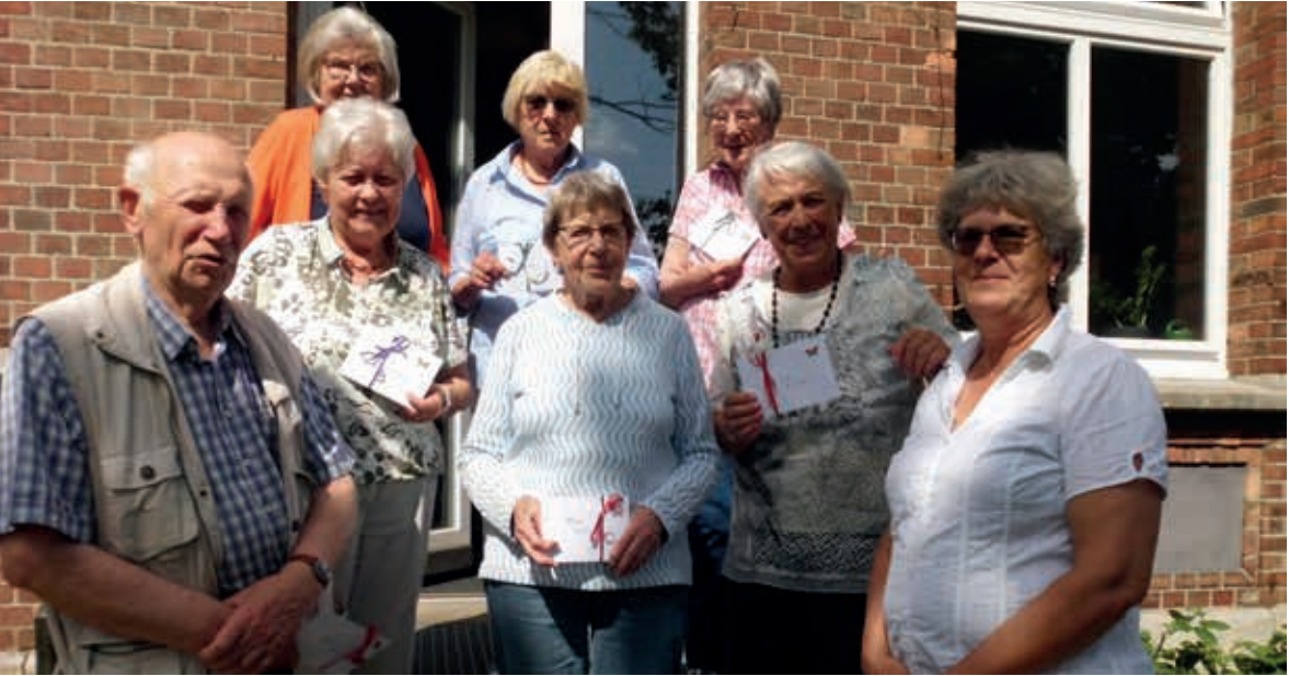
Foto links: Das neue Leitungsteam mit Helferkreis