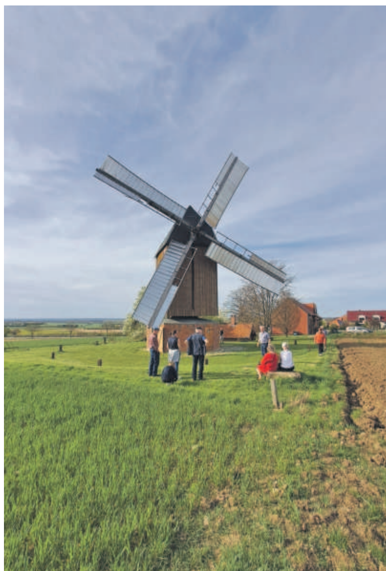
Die Bockwindmühle vor der Restaurierung mit dem Opel Blitz des Müllers Röhl

ABBENRODE Mitgliederversammlung des Mühlenvereins