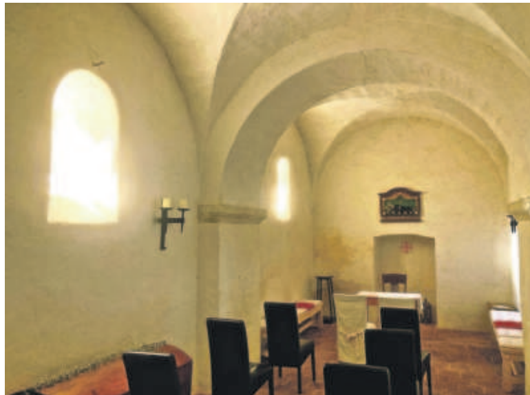
Turmsaal aus dem 12. Jahrhundert

Verfiel? – Na ja, nicht so ganz. Noch heute sind Fundamentfragmente einer Saalkirche und einer Damenstiftsempore aus vorromanischer Zeit, also aus der ersten Hälfte des 9. Jahrhunderts, erhalten und buchstäblich begreifbar. Zwischen den über tausendjährigen Gemäuern zu kraxeln, ist ein besonderes Erlebnis. Wahrhaftig Geschichte zum Anfassen. Es braucht dafür nur ein wenig Mut, Neugierde und Abenteuerlust. Lassen sie sich überraschen. Übrigens: Wer sich