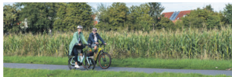
Ob zur Arbeit oder bei einem Ausflug in die Natur: Fahrradfahren lohnt sich und macht Spaß.

Alle Infos und Ergebnisse finden Sie unter www.stadtradeln.de/landkreis-wolfenbuettel . Die Teilnahme am Stadtradeln erfolgt in eigener Verantwortung. Die Kommune haftet für keinerlei Unfälle oder Schäden.