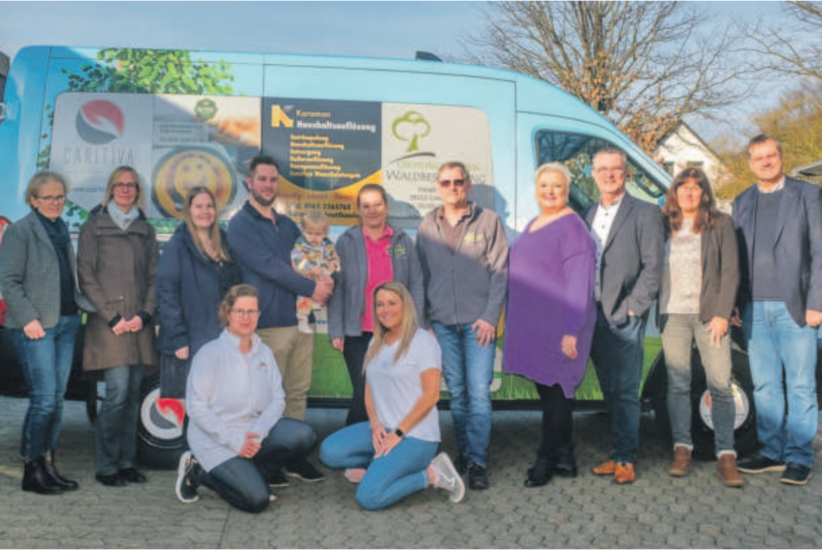
Nach dem gemeinsamen Kaffeetrinken mit einem Teil der Sponsoren gab es ein Gruppenfoto mit dem neuen Fahrzeug.

CREMLINGEN Finanzierung durch Werbeflächen