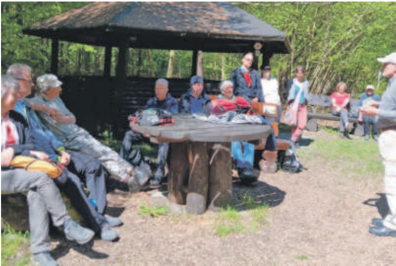
Pause am Drachenberg, mit 313 m einer der sieben höchsten Berge des Elms in der Nähe des Funkturms, der die englischen Soldaten - und auch die Anwohner - vor einigen Jahren mit Musik versorgte.

DESTEDT Unterwegs mit dem Ortsheimatpfleger