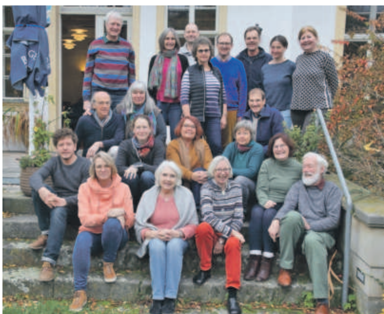
Der Chor „Canto Vivo“.