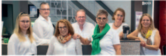
Das kompetente Team von Augenoptik Bock.

Bei einer Sehbehinderung oder Seheinschränkung spricht man immer häufiger von "Low Vision", was "geringeres Sehen" bedeutet. Low Vision tritt ein, wenn die Sehleistung kleiner als 30 Prozent ist. Dabei kommt eine Seheinschränkung nicht nur bei älteren Menschen vor. Die Ausprägungen einer Sehbehinderung können einen unterschiedlichen Charakter aufweisen, deswegen ist die Vielfalt des Angebots an Hilfsmitteln besonders wichtig. Wenn die normale Brille nicht mehr ausreichend ist und Lesen, Schreiben, Arbeiten am PC sowie Fernsehen nicht mehr optimal sind, können hochwirksame Sehhilfen, die Vergrößern und eine bessere Ausleuchtung schaffen, gegen die Beeinträchtigung im Alltag hilfreich sein.