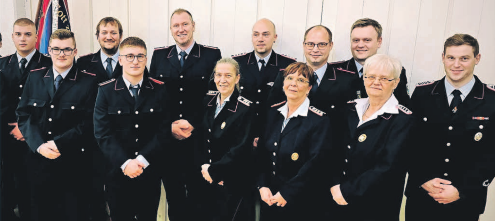
Beförderte und Geehrte

ABBENRODE Jahreshauptversammlung der freiwilligen Feuerwehr