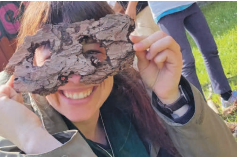
FÖJ beim Geopark.

REGION Freiwilliges Ökologisches Jahr im Geopark