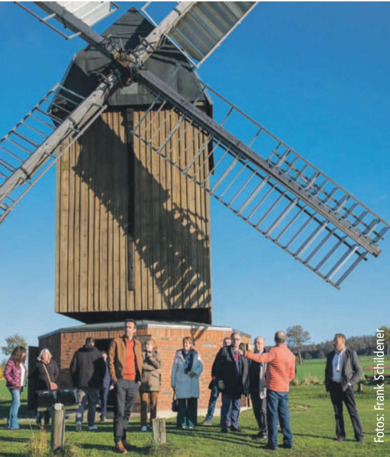
Besuchergruppe vor der historischen Bockwindmühle.

ABBENRODE Tatkräftige Unterstützer gesucht