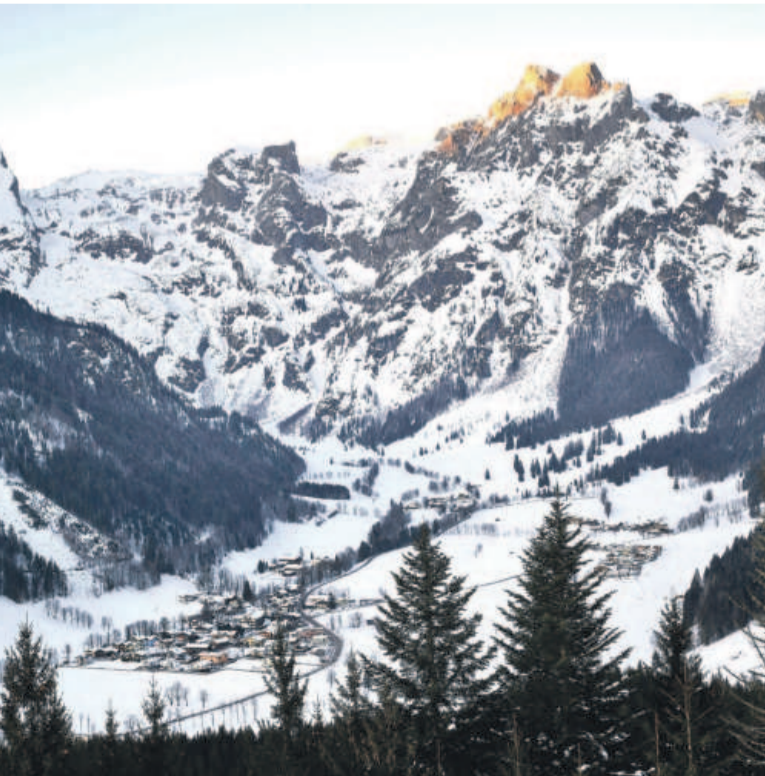
Werfenweng, Vorreiter des nachhaltigen Qualitätstourismus, hat sich der sanften Mobilität verschrieben.

in das Ladenberg- und Strussinggebiet starten oder die sechs Kilometer lange Panoramaabfahrt ins Tal antreten. Mehrere Anfängerareale, darunter der „Sunny Kids Park“ an der Mittelstation der Dorfbahn sowie der „Bobopark“ und der „Ikis Snowpark“ an der Ikarus-Bahn, machen den Einstieg in die Welt der sanften Schwünge zum spielerischen Vergnügen. Unter www.werfenweng.eu gibt es weitere Informationen und Inspirationen für einen abwechslungsreichen Winterurlaub.