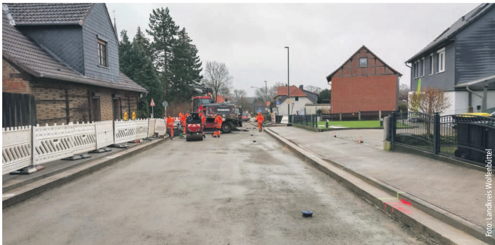
Das laufende Bauprojekt auf der Schapener Straße in Weddel.

Bauarbeiten werden im nächsten Jahr folgen. Der Wasserverband Weddel-Lehre und der Landkreis Wolfenbüttel bedanken sich bei allen Betroffenen für ihr Verständnis und ihre Geduld während der Bauphase.