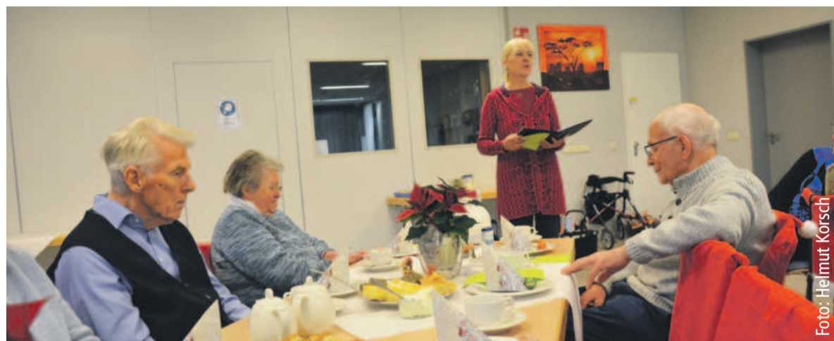
Gäste beim reichhaltigen Kuchenbuffet.