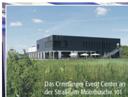
Das Cremlinger Event Center an der Straße Im Moorbusche 101

BRAUNSCHWEIG IHK-Sommerempfang im Cremlinger Event Center sorgt für Stau auf der A 39