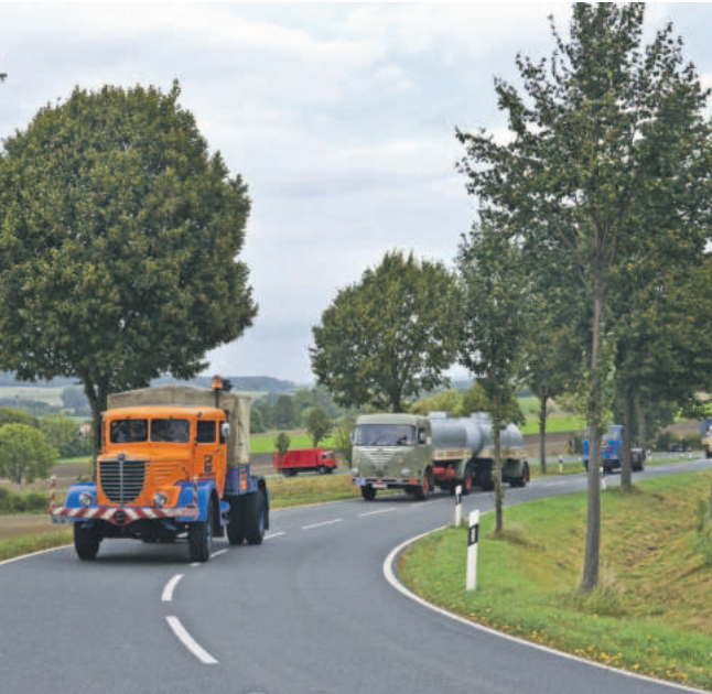
Bild links unten: Ein Büssing 8000, gefolgt vom grünen Büssing Commodore U. Das Bild unten rechts zeigt eine Rarität, nämlich das Schienenfahrzeug Büssing LU11/16, das naturgemäß nicht an der Elm-Ausfahrt teilnehmen wird.

formlose Anmeldung unter: anmeldung@buessing-verein.de . Nähere Informationen unter: www.buessing-verein.de . Der Büssing Verein freut sich über viele historische Fahrzeuge und zahlreiche Zuschauer und Fotografen. Auf der nächsten Seite finden Sie einen detaillierten Tourenplan.