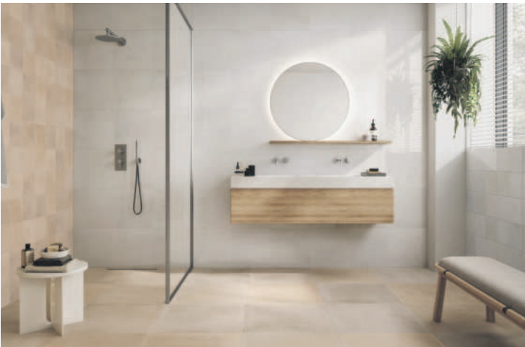
Wohlfühlambiente im Bad: Boden und Wände in Natursteinoptik, viel Holz und freundliches, indirektes Licht.

Look, Terrazzo- oder Terrakottaoptiken bringen einen Hauch von mediterranem Landhaus in die eigene Wohnung. Allen keramischen Belägen gemeinsam ist dabei ihre hohe Pflegeleichtigkeit und Haltbarkeit. Besonders umweltfreundlich produziert werden Fliesen in Deutschland. Unter www.deutsche-fliese.de gibt es dazu viele weitere Informationen und spannende Einrichtungsinspirationen.