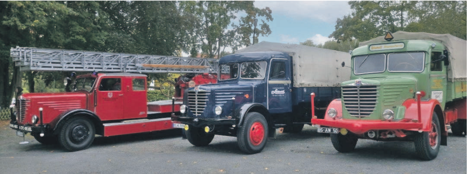
Sie sind einfach schön, die Büssing-Fahrzeuge aus alten Zeiten, an die sich viele aus der Region noch gut erinnern können. Denn Büssing ist ein Braunschweiger Unternehmen gewesen, das später von MAN übernommen wurde. Unser Foto zeigt die drei Modelle 500 S, 6000 S und 8000 (von links).