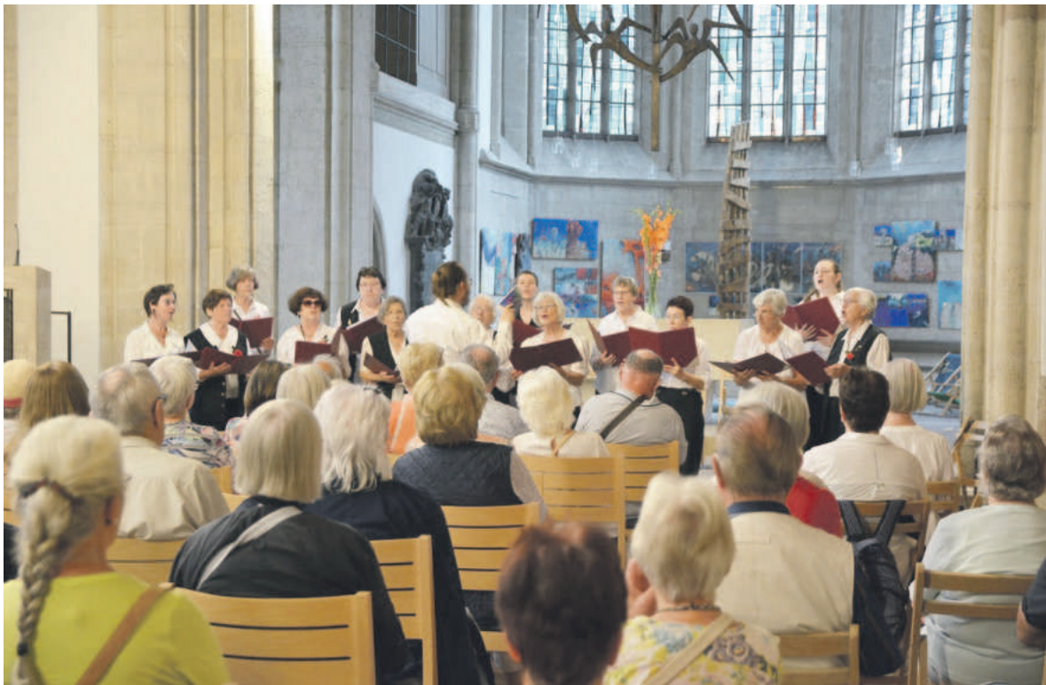
Der Fauenchor in der Braunschweiger Magni-Kirche

Der Kulturkreis Abbenrode veranstaltet am 22. September wieder einen Dorfflohmarkt. Gleichzeitig findet auf der Wiese um das Dorfgemeinschaftshaus der Flohmarkt „Rund ums Kind“ statt. Das Angebot des Dorfflohmärktes besteht aus allen Dingen, die in Kellern, Schuppen und Garagen aussortiert wurden. Der Kinderflohmarkt bietet überwiegend Kinderkleidung und Spielzeug an. Aus diesen Gründen glauben wir, dass sich Angebote der beiden Flohmärkte gut ergänzen und hoffen, möglichst viele Interessierte nach Abbenrode zu locken. Es ist für die Besucher eine hoffentlich willkommene Gelegenheit, zwischendurch auch einmal durch das schöne Dorf zu schlendern und die eine oder andere nette Entdeckung zu machen. Es gibt Ponyreiten durch das Dorf und auf vielen Höfen werden Ge- tränke, Kuchen, Pommes und Grilltes angeboten. Die Flohmärkte finden von 10 Uhr bis 16 Uhr statt. Abbenrode freut sich auf seine Gäste. Wer Lust und Zeit hat, ist ab 9 Uhr herzlich gern zum Aufbau willkommen (Kontakt: Holger Dietze per holger_dietze@hotmail.com). Wir sehen uns am 22. September, bei hoffentlich sonnigem Wetter, in Abbenrode am Elm. Der Kulturkreis