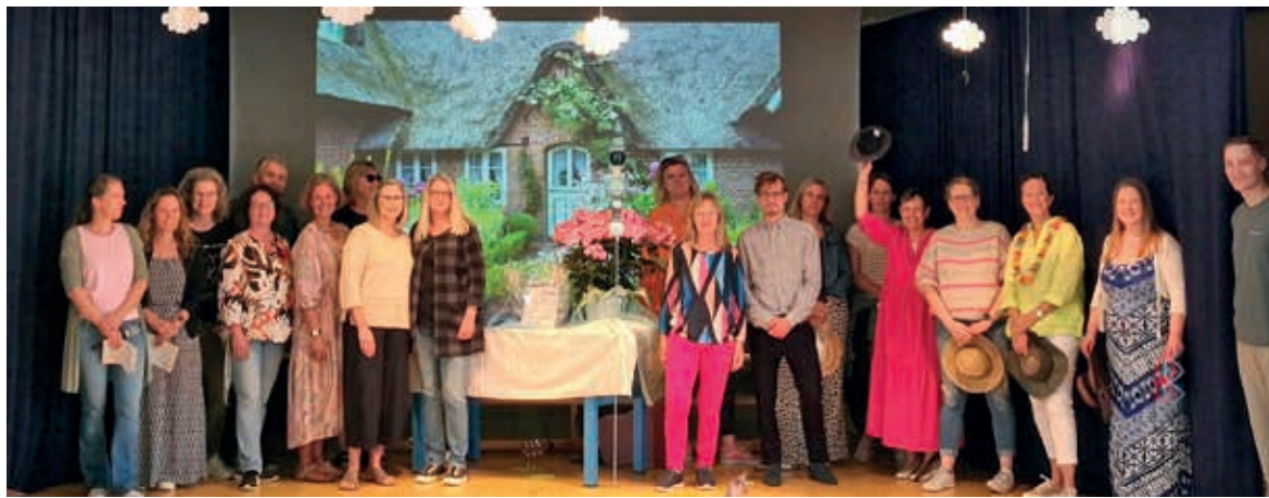
Das Kollegium der Erich-Kästner-Schule.

WEDDEL Verabschiedungsmarathon in der Erich-Kästner-Schule