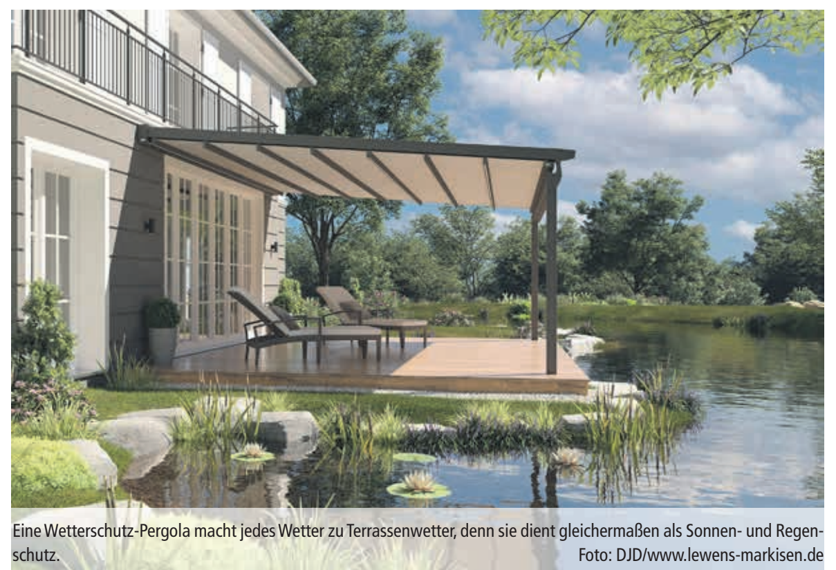
Eine Wetterschutz-Pergola macht jedes Wetter zu Terrassenwetter, denn sie dient gleichermaßen als Sonnen- und Regenschutz.

Die Bespannung in trendigen Uni-Farben muss hohen Qualitätsansprüchen genügen. Haltbare, lichtbeständige Beschichtungen