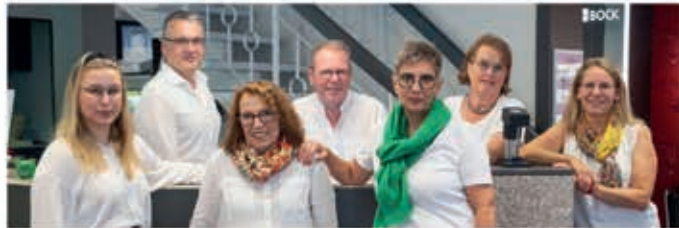
Das kompetente Team von Augenoptik Bock.

Bei einer Sehbehinderung oder Seheinschränkung spricht man immer häufiger von "Low Vision", was "geringeres Sehen" bedeutet. Low Vision tritt ein, wenn die Sehleistung kleiner als 30 Prozent ist. Dabei kommt eine Seheinschränkung nicht nur bei älteren Menschen vor. Die Ausprägungen einer Sehbehinderung können einen unterschiedlichen Charakter aufweisen, deswegen ist die Vielfalt des Angebots an Hilfsmitteln besonders wichtig. Wenn die normale Brille nicht mehr ausreichend ist und Lesen, Schreiben, Arbeiten am PC sowie Fernsehen nicht mehr optimal sind, können hochwirksame Sehhilfen, die Vergrößern und eine bessere Ausleuchtung schaffen, gegen die Beeinträchtigung im Alltag hilfreich sein.