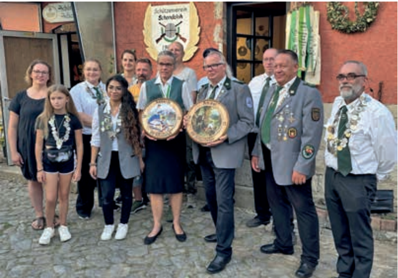
Die Sieger des Herbstpreisschießens 2023.

SCHANDELAH Herbstpreisschießen ab 23. August