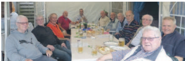
Sangesbrüder in gemütlicher Runde.