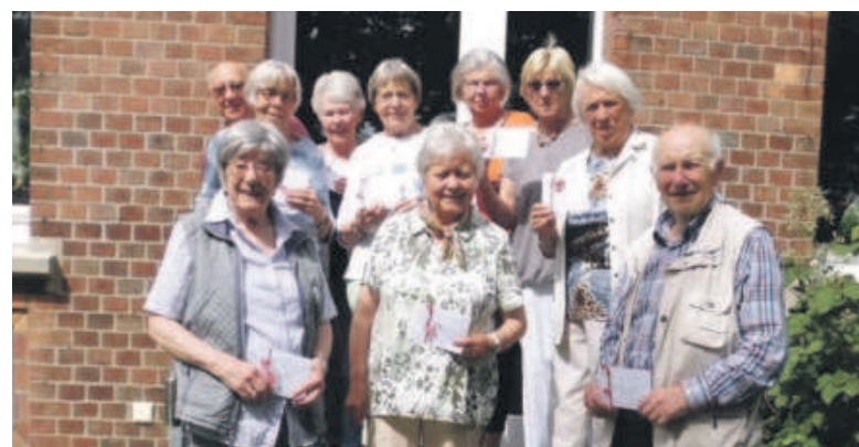
Die Leitung und die Helfer/innen des Seniorenkreises Weddel mit dem „Danke schön“-Geschenk.

WEDDEL Ausflugsfahrt und Jahreshauptversammlung