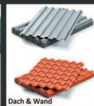
Dach & Wand