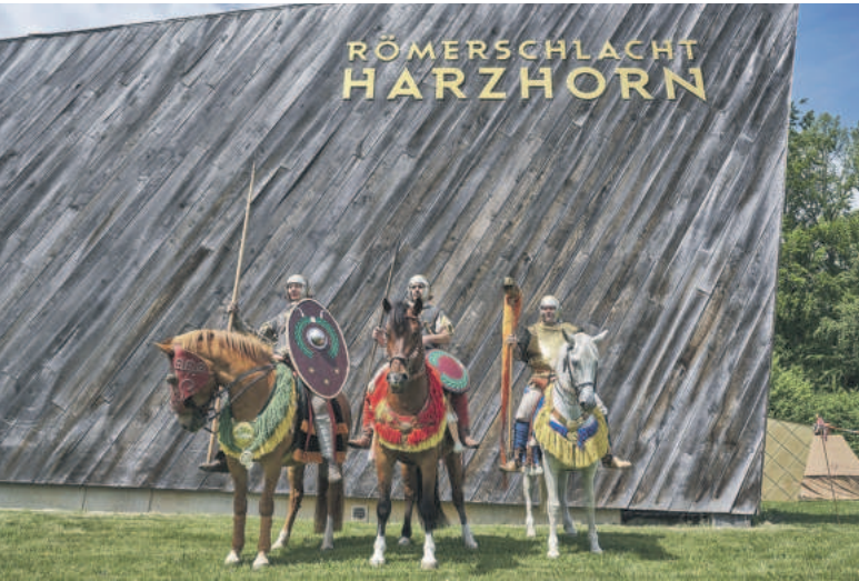
Römische Reiter vor dem Informationsgebäude.