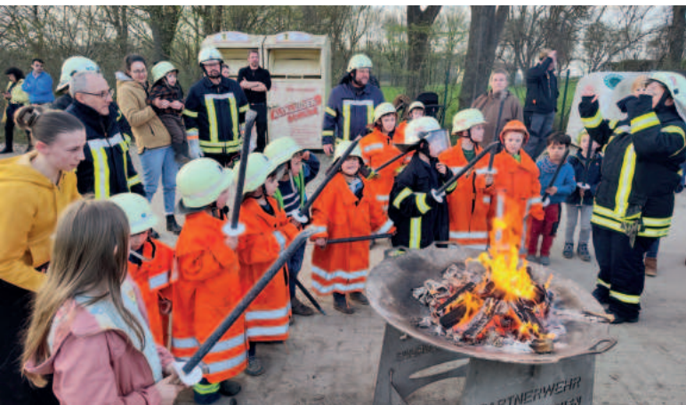
Die kleinen Hemkenröder bereiten sich auf den großen Moment vor.

HEMKENRODE Osterfeuer lockte zahlreiche Besucher an