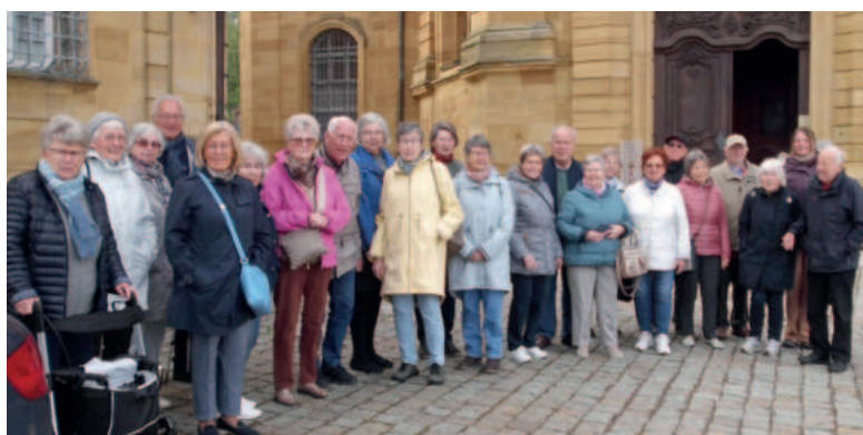
Gruppe vor der Basilika Vierzehnheiligen

WEDDEL Viertagesfahrt des Seniorenkreises