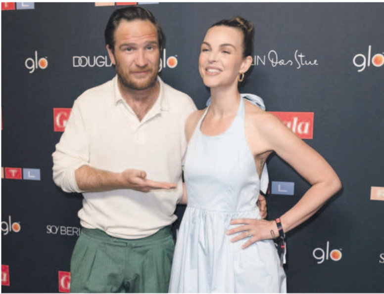
Glamour-Paar: Doch hinter den Kulissen geht es bei Frederick und Annika Lau manchmal temperamentvoll zu.

(pst). Es ist eine wilde Hetzjagd von Berlin über Wien und Genua bis nach Marseille: In der neuen Gangster-Serie „Crooks“ auf Netflix rast Frederick Lau actionreich durch die Weltgeschichte. „Ein richtig cooler Dreh“, erinnerte er sich gerade in Sat.1: „Und dann kommst du nach Hause und musst dich wieder aufs normale Leben einstellen. Das ist total schwer.“ Dennoch ist der 34-Jährige immer glücklich, bei Frau und Kindern zu sein. So schwärmt er in der „Berliner Morgenpost“ über seine Ehefrau, Moderatorin Annika Lau (45, „Gala TV“): „Sie gibt mir Halt und Erdung, denn sie ist mein Ruhepol, wofür ich ihr dankbar bin. Wir sind füreinander da, haben viel Freude miteinander und lieben uns.“ Das heißt aber nicht, dass es im Hause Lau nicht auch mal Knatsch gibt. „Natürlich funktionieren wir auch auf italienische Weise, das heißt, da fliegen schon mal die Fetzen“, lacht Frederick.