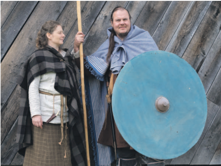
Typische Kleidung der Germanen um 235 n. Chr. ©Dr. Holger Gilhaus, Göttingen

Das Schlachtfeld ist gut erhalten und lohnt einen Besuch. Wissenschaftler gehen davon aus, dass es bei dieser Schlacht keinen eindeutigen Sieger gab. Zwar machten die Germanen wohl reichlich Beute, aber die Römer zogen ohne allzu große Verluste weiter in Richtung Süden. Neben Gästeführungen können sich Besucher auf einem Themenpfad, der über das Gefechtsfeld führt, über die Kampfhandlungen und die hier gemachten Funde informieren. Ein Informationsgebäude und diverse Schautafeln am Wegesrand vermitteln einen interessanten Einblick in das Geschehen um 235 nach Christus. Das Gebäude und Gelände ist von April bis Oktober jeden Sonntag in der Zeit zwischen 11 Uhr und 16 Uhr und jeden dritten Samstag im Monat ebenfalls von 13 Uhr bis 16 Uhr für Besucher geöffnet. Von November bis März dann wieder sonntags von 13 Uhr bis 16 Uhr. Eine etwa zweistündige öffentliche Führung beginnt am Informationsgebäude jeweils um 14 Uhr. Der Zu-