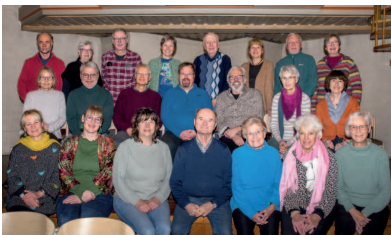
Chor Cantamus im Dezember 2023

WEDDEL Chor und Förderverein feiern am 5. Mai