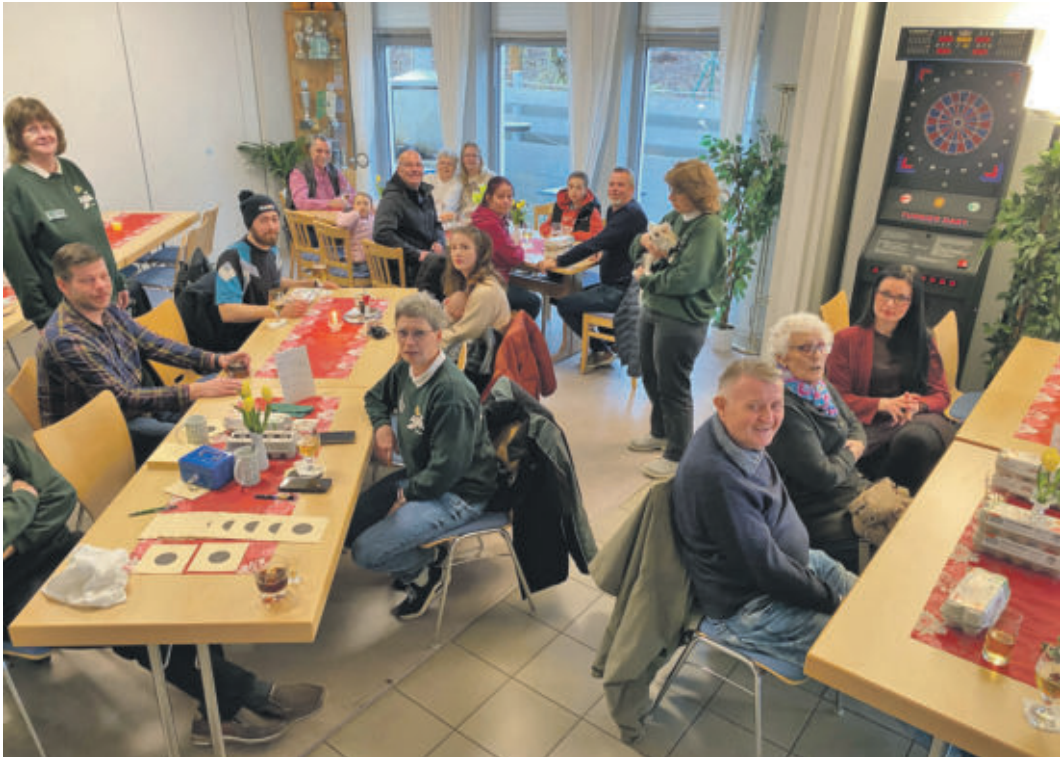
Teilnehmer beim gemütlichen Abschluss.

WEDDEL Ostereier-Schießen beim Schützen-Sport-Verein