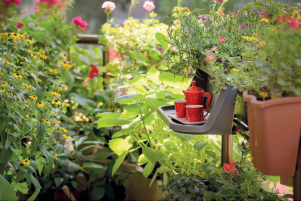
Mit den passenden Pflanzen wird der eigene Balkon zum Eldorado für Insekten.

TIPP Welche Pflanzen Bienen und Schmetterlinge mögen und was sonst noch wichtig ist