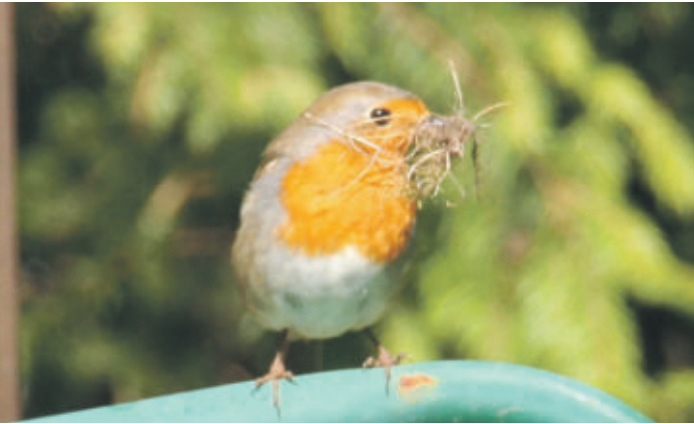
Rotkehlchen beim Nestbau