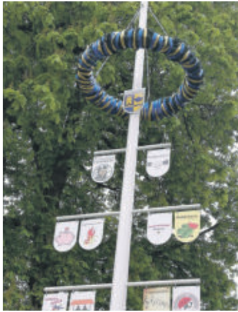
Maibaum aufstellen im letzten Jahr