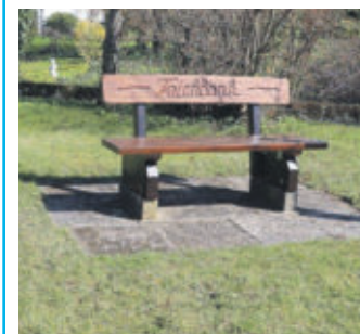
Die neue Teichbank in Destedt Ecke Elmstraße/Kleigarten lädt zum Verweilen ein.

Einen Teich gibt es schon lange nicht mehr im oberen Teil der Ortschaft Destedt und die Bezeichnung Teichbank für die Sitzgelegenheiten an der Ecke Elmstraße/Kleigarten verursachte bei vielen Menschen nachdenkliche Stirnrunzeln. Aber es gab exakt an dieser Stelle mal