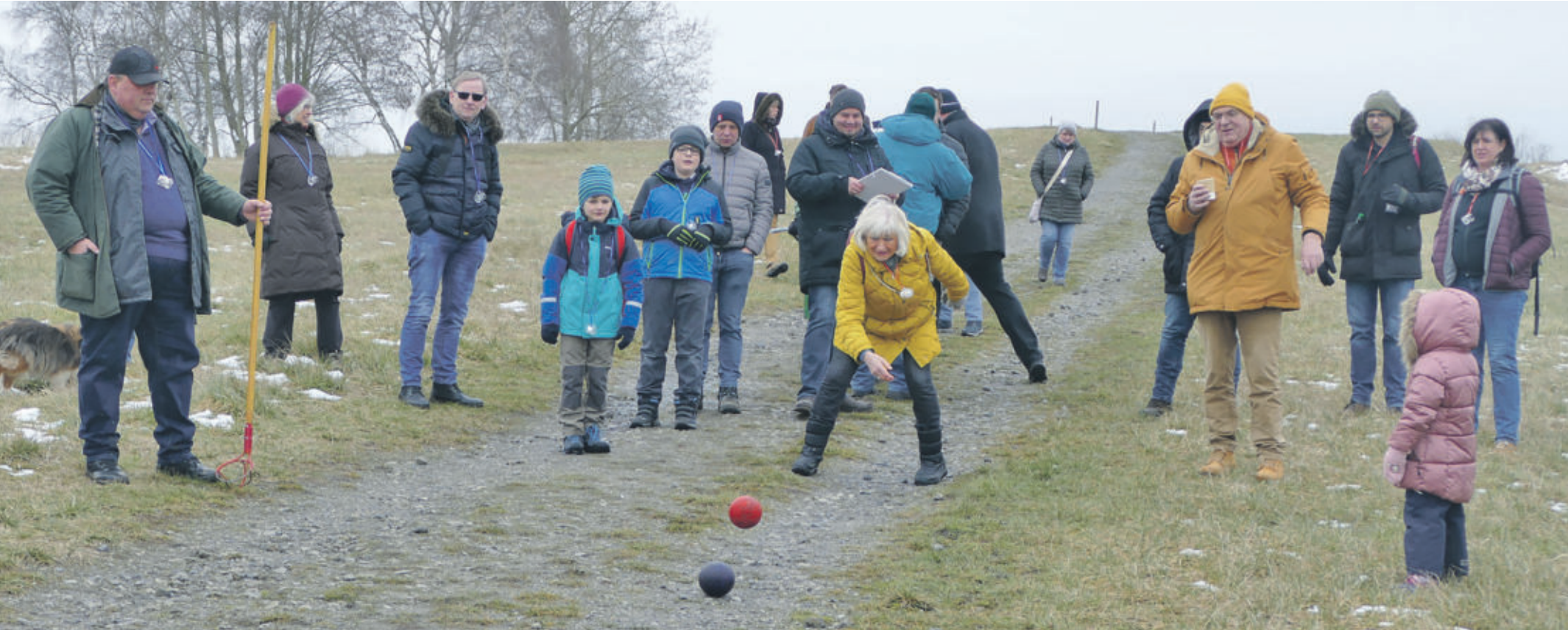
Die rote Kugel jagt die blaue

CREMLINGEN CDU-Ortsverband und Gäste trafen sich zum Sport und Braunkohlessen