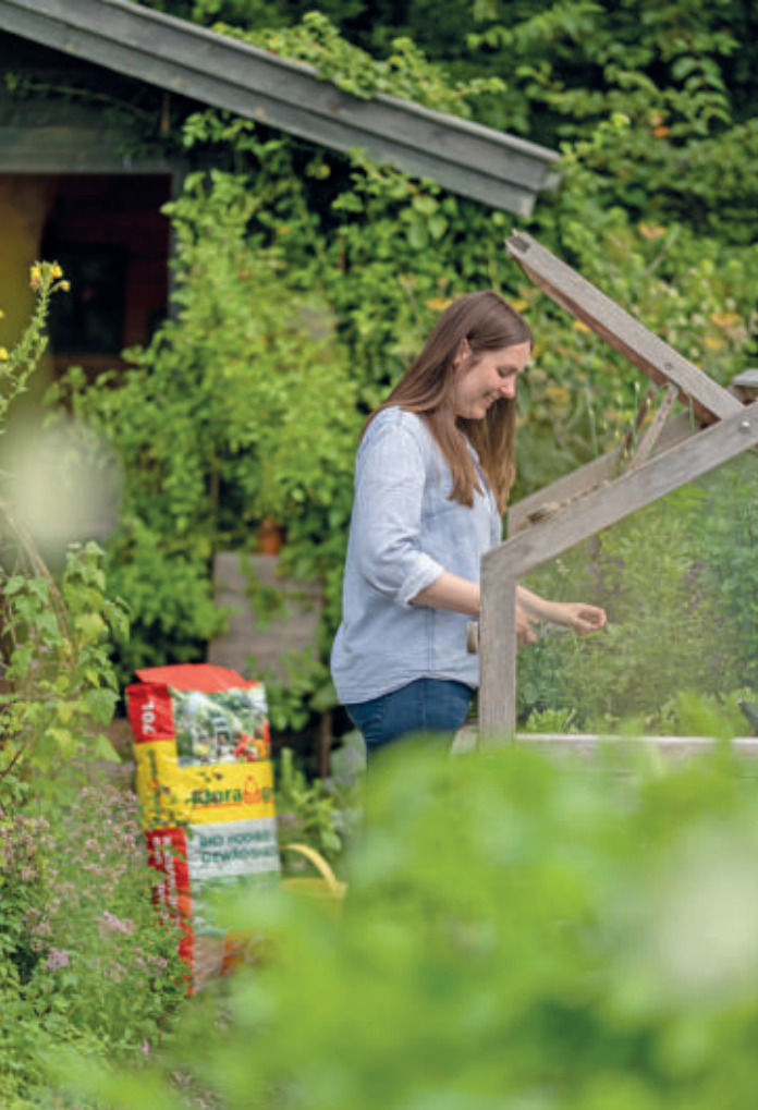
Neben der richtigen Pflanzenauswahl kommt es bei Hochbeeten insbesondere auf die Befüllung und auf eine hochwertige Erde an.

Neben den richtigen Pflanzen freuen sich Insekten zudem auch auf dem Balkon über ein Insektenhotel. Darin können sie nisten und sich zurückziehen. Insektenhotels gibt es in verschiedenen Größen. Sie sollten an einem sonnigen Ort aufgestellt oder aufgehängt werden, an dem sie vor Regen und Wind geschützt sind. Die Behausungen sind meist aus Holz, Kiefernzapfen und anderen natürlichen Materialien gefertigt. Wichtig ist, dass das Insektenhotel im Winter hängen bleibt. Sonst schlüpfen die Nachkömmlinge zu früh und sterben. Auch eine flache Trinkschale mit Steinen lockt Bienen, Schmetterlinge und Co. an und lädt sie zum Verweilen ein. So wird der städtische Balkon ohne viel Aufwand zum Insektenparadies.