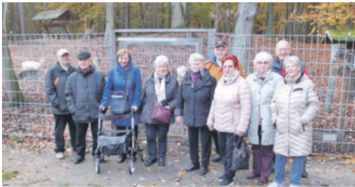
Teil der Gruppe am Tiergehege - Forsthaus Barsberge

Die Novemberfahrt des Seniorenkreises Weddel führte die Gruppe wieder nach Arendsee zum Gänsebratenessen. Pünktlich ging es los und auch die Sonne war zur Stelle und lugte schon mal zwischen den dunklen Wolken durch. Es war eine angenehme Fahrt über Wolfsburg und Ehra-Lessin in Richtung Salzwedel. Von dort war es nicht mehr weit bis nach Arendsee. Im Hotelrestaurant „Deutsches Haus“ wurden wir schon erwartet. Das Essen war wieder ausgesprochen lecker. Die Hochzeitssuppe wärmte den Magen schon mal vor und einige gebratene Gänse wurden vor unseren Augen zulegt und jeder konnte sich sein Lieblingsstück auswählen. Auch die Beilagen und der Gänsebraten wurden nachgereicht. Zum Abschluss gab es ein kleines Dessert. Der anschließende Glühwein wurde in der Hofschene eingenommen.