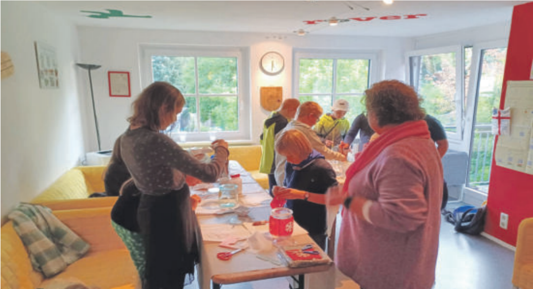
Vorbereitung für das Friedenslicht

VELTHEIM/WEDDEL Friedenslicht kommt am 10. Dezember