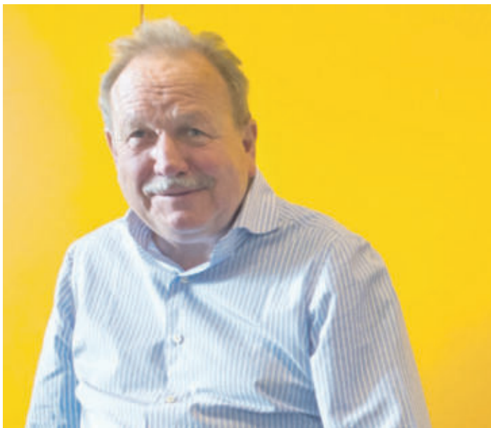
Frank Bsirske (MdB)