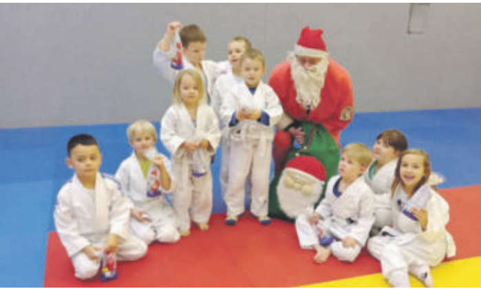
Die Judolaus zu Besuch bei den Mini-Judofüchsen

HORDORF Judofüchse freuten sich über Besuch