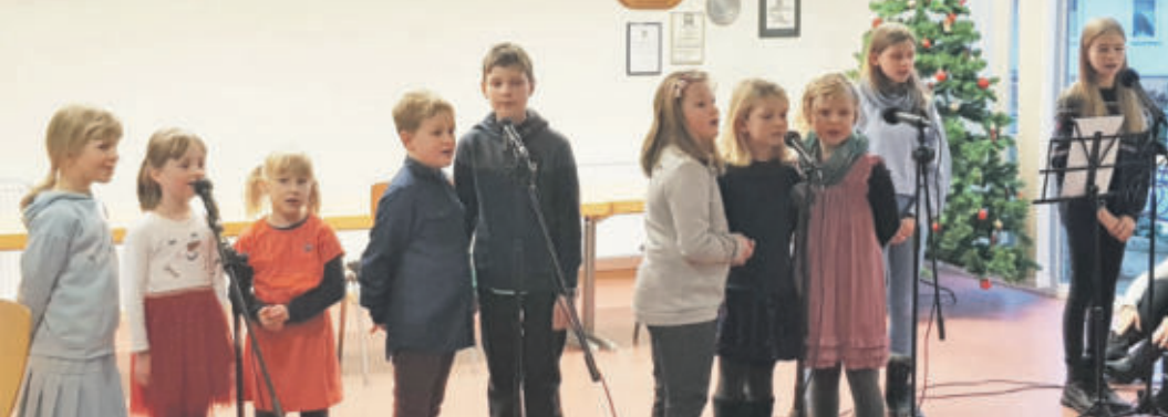
Der Kinder-Chor der Krippenspielgruppe