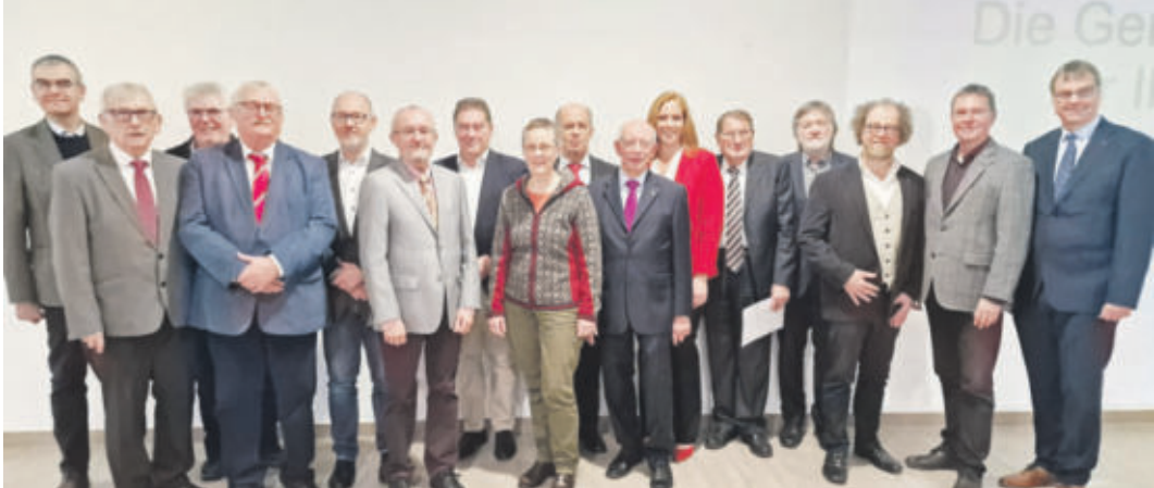
Die Geehrten des Jahres 2021