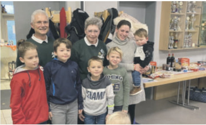
Teilnehmende Kinder nach dem Lichtpunkt-Schießen.