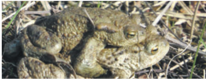
Ein Doppeldecker auf dem Weg zum Laichgewässer.

VELTHEIM/OHE Nächste Planung am 30. Januar