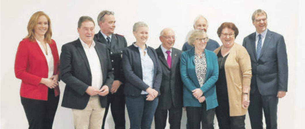
Die Geehrten des Jahres 2020