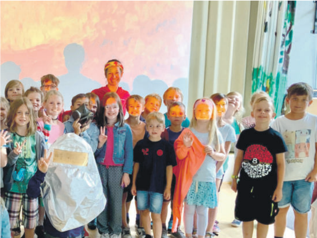
Die Schülerinnen und Schüler freuen sich, eine echte Vulkan-Forscherin zu treffen

SCHANDELAH Grundschulkinder treffen eine Vulkanologin