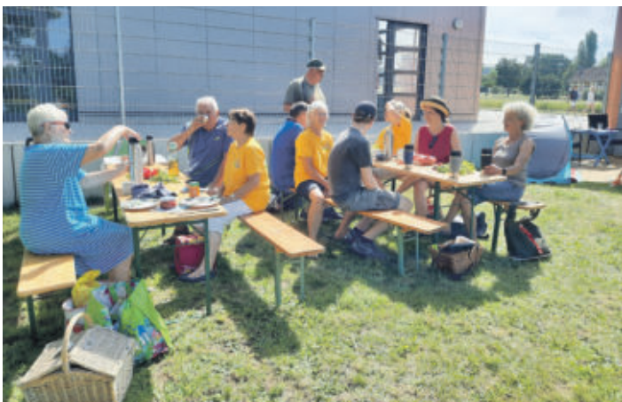
Einige der Frühstücksgäste im Freibad am Elm