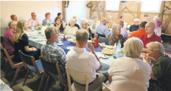
Kaffeegespräch in der Scheune