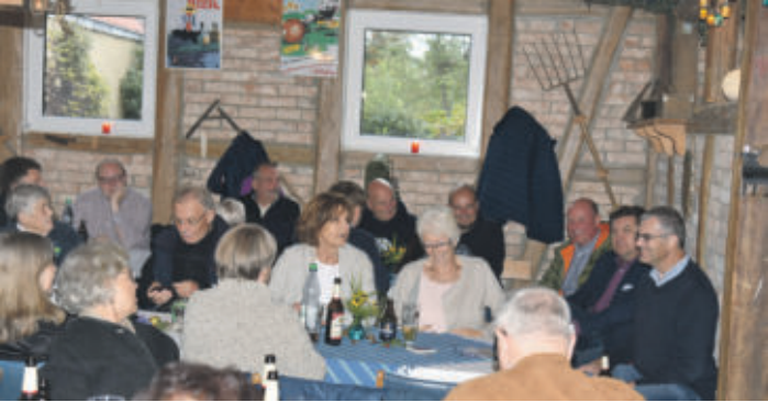
Warten auf das Spanferkel in froher Runde