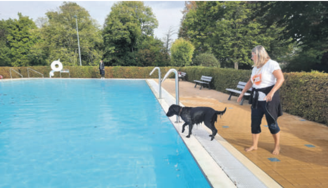
Der erste tierische Badegast mit Begleitung

HEMKENRODE Freundeskreis Freibad am Elm freute sich über große Beteiligung