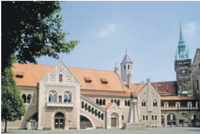
Burg Dankwarderode

1990er Jahre wurde er nach alten Vorlagen von Ludwig Winter weitestgehend originalgetreu rekonstruiert. Sehenswert sind die aufwendigen Ausmalungen der Wände, die imposanten Radleuchter aus vergoldeter Bronze unter dem offenen Dachstuhl und auch die aufwendige Gestaltung der Säulenarkaden. In der angrenzenden Kemenate sind beeindruckende Darstellungen aus dem Leben Heinrichs des Löwen zu sehen. Der repräsentative Rittersaal in seinem goldenen Glanz bildet heutzutage einen angemessenen Rahmen für offizielle Empfänge. Hier treffen sich unsere Stadtoberhäupter mit hochkarätigen Gästen aus aller Welt. Und Sie haben die Gelegenheit, diesen wahren Schatz der Stadt Braunschweig ebenfalls zu besuchen. Für Besucher geöffnet ist die Burg Dankwarderode von Dienstag bis Sonntag zwischen 10 Uhr und 17 Uhr. Der Eintritt kostet für Erwachsene 5 Euro, ermäßigt 2,50 Euro, Kinder zwischen 6 und 17 Jahren zahlen 2 Euro. - Günstiger kann man wohl selten mal eine Zeitreise ins Mittelalter unternehmen. Viel Spaß und eine Menge an bleibenden Eindrücken wünscht Ihre Regionalzeitung.