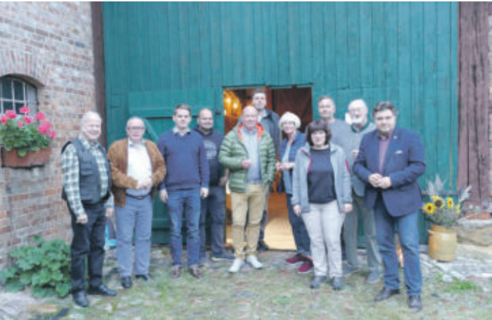
Der CDU-Ortsverbandsvorstand mit Gästen

CREMLINGEN CDU-Ortsverband lud zu geselligem Gedankenaustausch