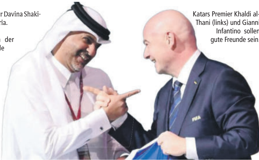
Katars Premier Khalid al-Thani (links) und Gianni Infantino sollen gute Freunde sein.

Bild links unten: In der schicken FIFA-Zentrale in Zürich suchen die Strategen sicher schon den nächsten Geldgeber für noch größere Spiele.