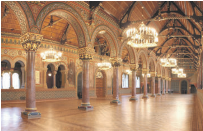
Burg Rittersaal