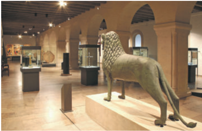
Burg Knappensaal