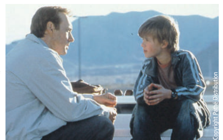
Das Glücksprinzip: Kevin Spacey, Haley Joel Osment

„Das Glücksprinzip“ ist ein Film, der zum Nachdenken und Hinterfragen an-