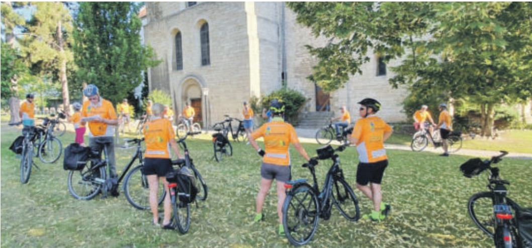
Zwischenstopp in Schöningen während einer mehrtägigen, geführten Radtour im Sommer 2020, die mit dem Förderprogramm „Rauf auf’s Rad“ unterstützt wurde.

REGION Regionalverband fördert weitreichend die Regionalentwicklung